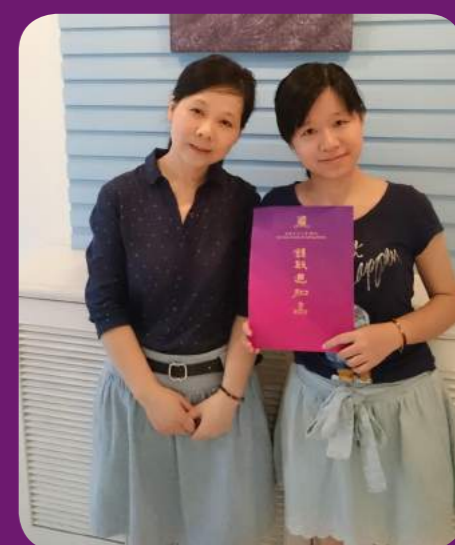
这是我与妈妈的合照

感言：手中的录取通知书是一扇辉煌的门，它连接着过去与将来，凝聚着我的汗水和父母的付出，更将开启一条通往梦想的道路。我会心怀感激，不忘初心，坚韧前行。There are a lot of dawn of day, the sun is just a star.