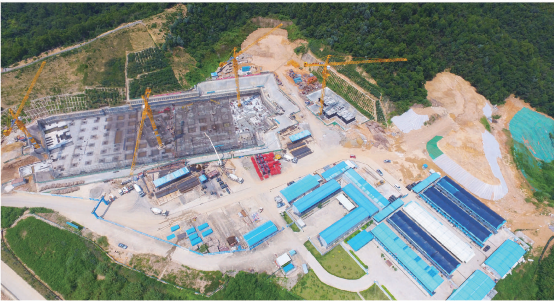
2015年9月 September, 2015