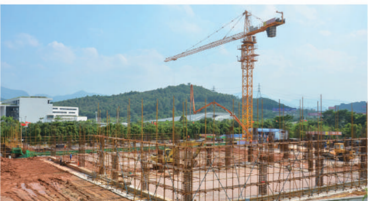
2015年6月 June, 2015