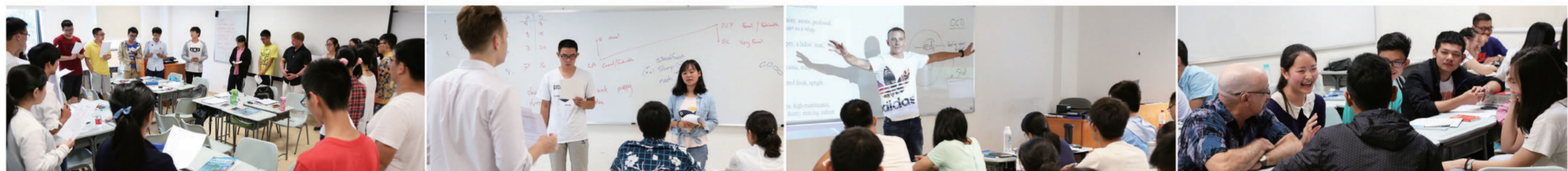
2016 级暑期新生英文培训班课堂上，新生们积极与外教互动