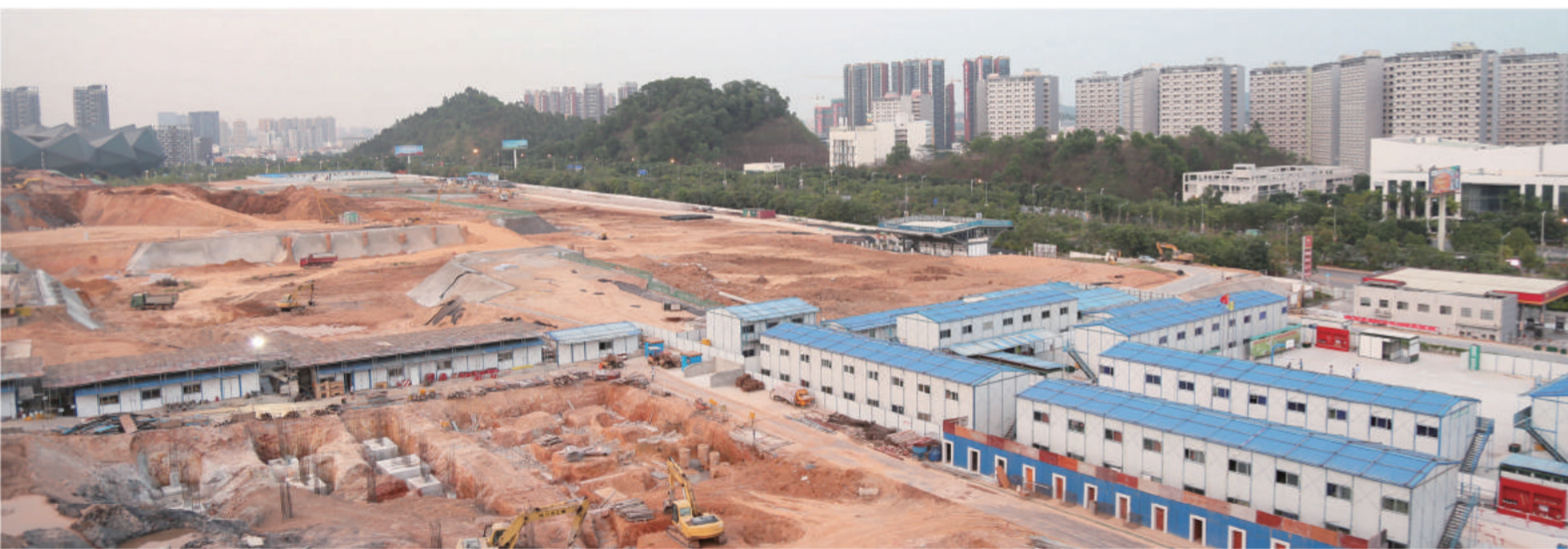
2015年4月 April, 2015