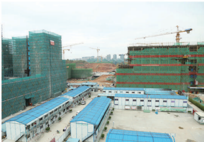
2016年2月 February, 2016