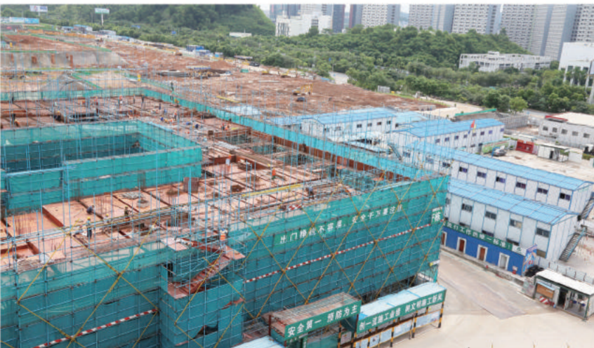
2015年9月 September, 2015

This semester, nearly 2000 students will move into the newly-built Shaw College, while new buildings can already be seen in the Low Campus, stirring people's expectation of the new look of the university.