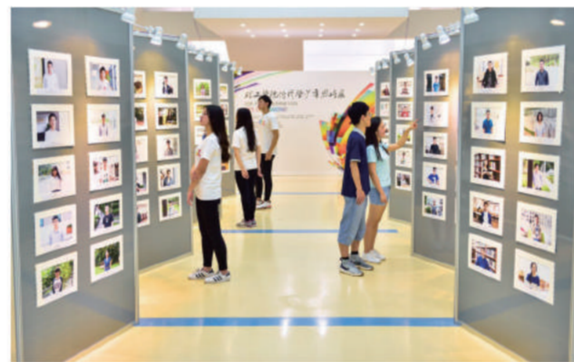
恰同学少年照片展 Hey Companions! Photo Album