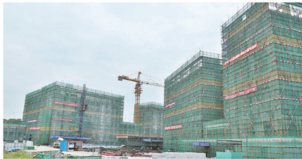
2016年6月 June, 2016