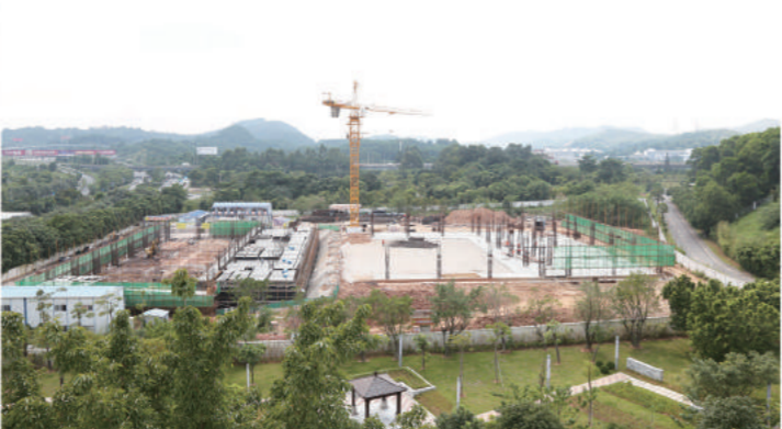
2015年10月 October, 2015