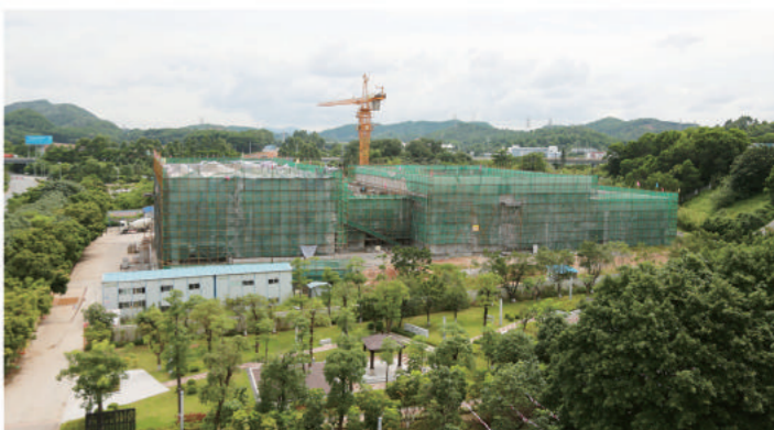
2016年8月 August, 2016

未来,我们与港中大(深圳)共同成长! Embrace the future with The Chinese University of Hong Kong, Shenzhen