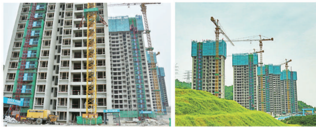
2016年8月 August, 2016