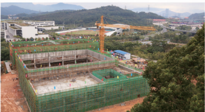
2016年2月 February, 2016