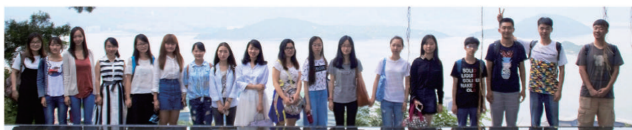
第二届金融工程理学硕士生在香港中文大学“天人合一”景点前合影

我们常说看一所大学就要看它的图书馆。香港中文大学(深圳)给我留下第一个深刻印象的就是这富有文人气息的图书馆。从门口贴心的“手机休息处”到一排排中外藏书，细致周到的布置让我们的心归于宁静并投入到学习之中。