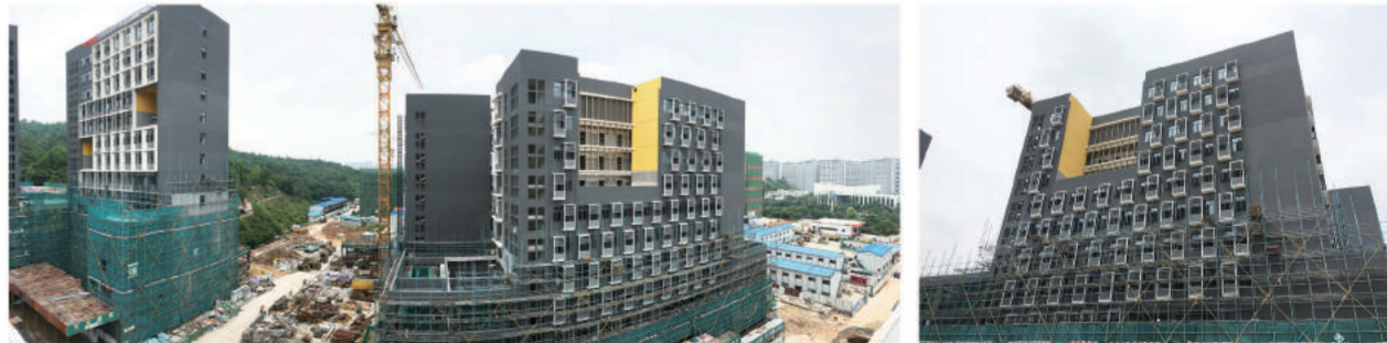
2016年6月 June, 2016