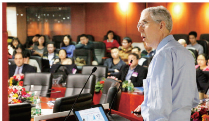
大数据科学国际研讨会 Shenzhen Research Institute of Big Data First Workshop of Data Science