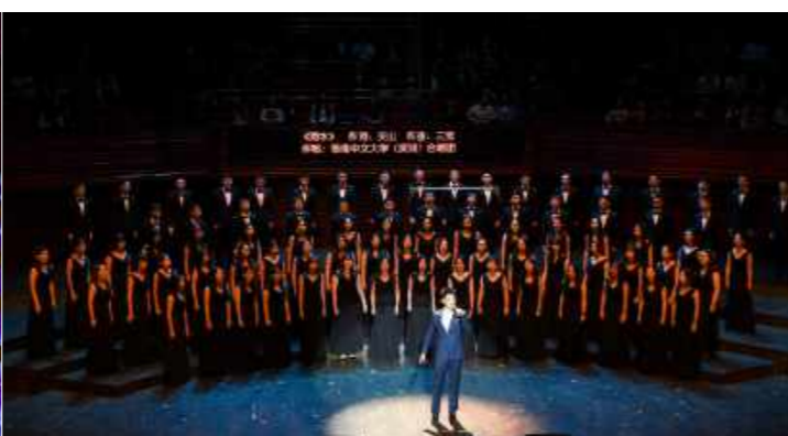
特邀嘉宾、中国音乐剧演员刘岩献唱音乐剧选曲《练习曲》《海水》，香港中文大学 (深圳) 合唱团伴唱。