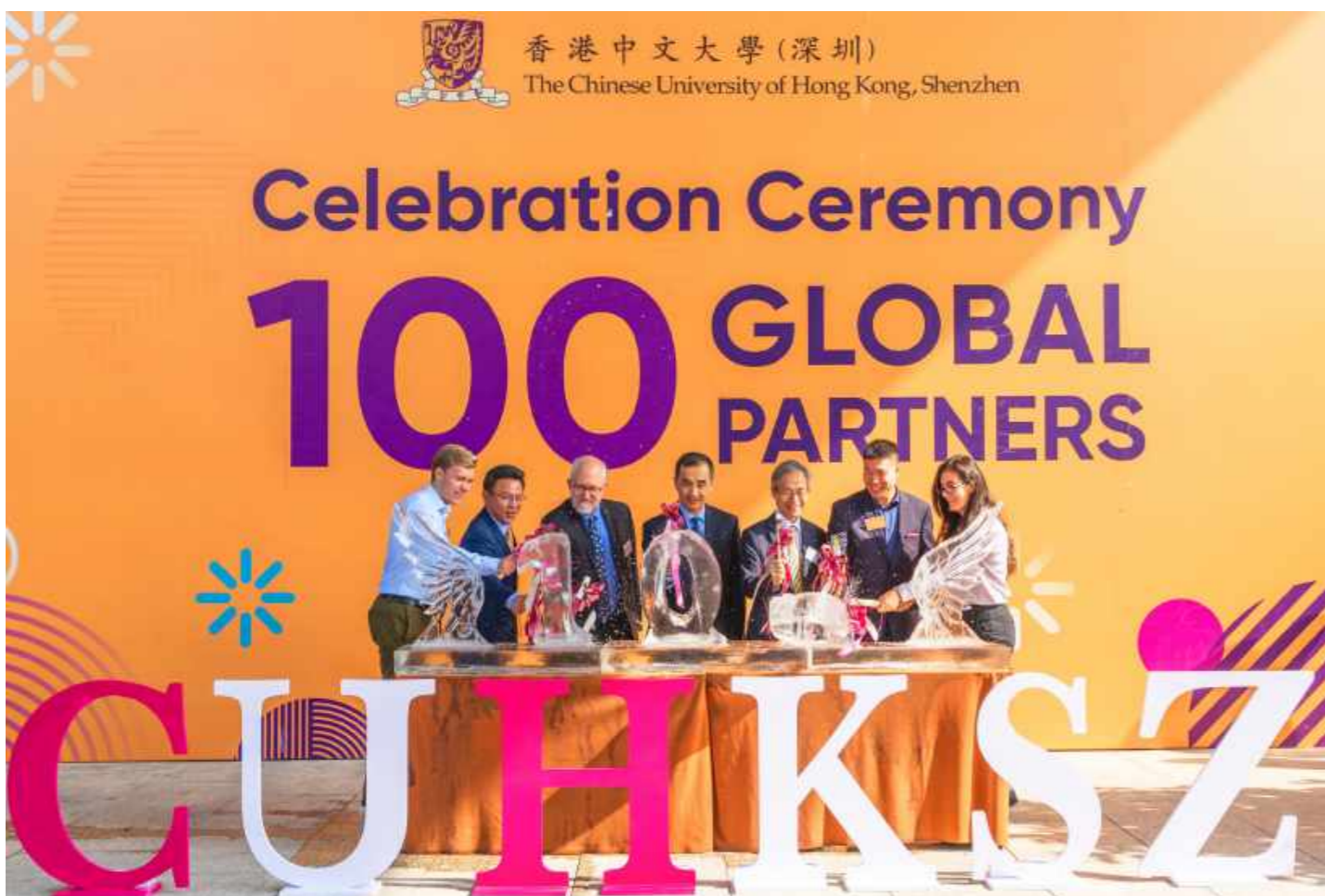
海外嘉賓與港中大(深圳)校領導共同啟動破冰儀式

近日，香港中文大學(深圳)與耶魯大學簽署學生交流合作協議，成為港中大(深圳)國際化進程中的一個里程碑式的時刻。耶魯大學也成為港中大(深圳)的第一百個國際合作夥伴。根據兩校協議，從2020年開始，港中大(深圳)將選派10名左右學生赴耶魯大學學習一學期或一學年，他們將和耶魯大學全日制本科生同堂學習和共同生活。